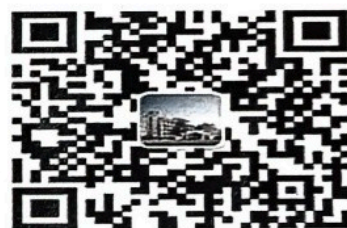
福州屏东中学公号